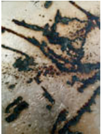
Contingency [Scale], 2014

Aktiviert 2013; fotografiert 2014 / Activated 2013; photographed 2014 Silber, Schwefel, Lack, Gesso auf Leinwand / Silver, liver of sulfur, varnish, gesso on canvas 44 x 36 cm