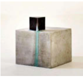
Notation VII, 2000/2014 Kalksandstein, Bronze, Ammoniumchlorid Kupfersulfat / Limestone, bronze, ammonium chloride copper sulfate 40 x 30 x 30 cm