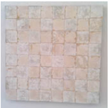
A man in the desert who thinks he is walking in a straight line, tends to bear left, 1991 Titandioxid, Zinksulfat, Lack auf Leinen / Titanium dioxide, zinc sulfate, varnish on linen 76 x 76 x 4 cm