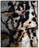
Contingency [Traces], 2013

Aktiviert 2013; fotografiert 2014 / Activated 2013; photographed 2014 Silber, Schwefel, Lack, Gesso auf Leinwand / Silver, liver of sulfur, varnish, gesso on canvas 44 x 36 cm